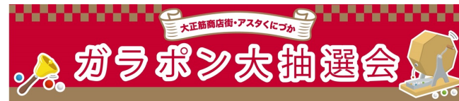
ロゴマーク・会場看板