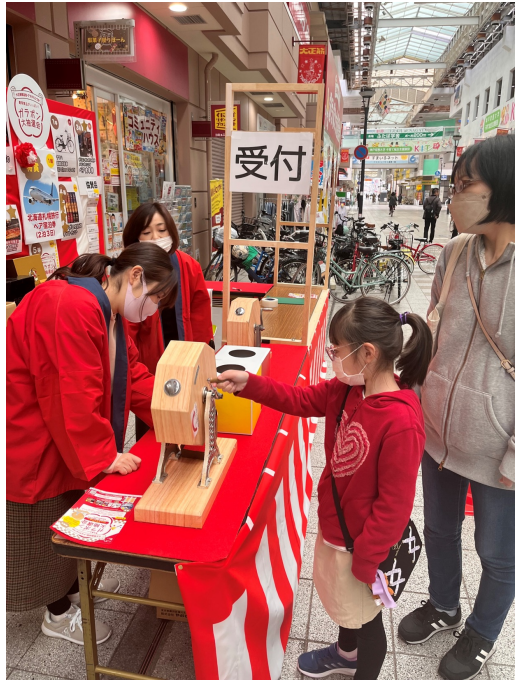
抽選会様子 (コミュニティハウス前)