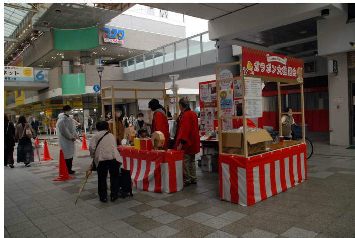
抽選会様子 (L&Wフェス・イベント時)